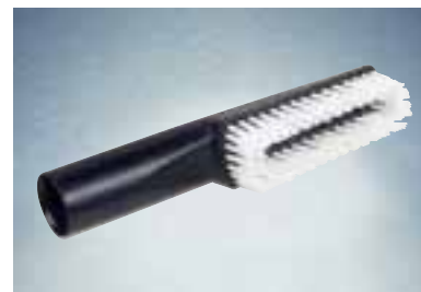
Borstelzuigmond langwerpig 6086

Voor het zuigen van radiatoren en andere nauwe, moeilijk toegankelijke plaatsen.