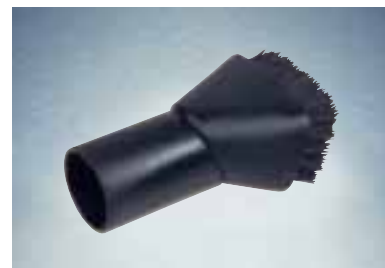
Borstelzuigmond rond 5146

Voor het zuigen van grote, gevoelige oppervlakten zoals bureau's en andere meubelen.