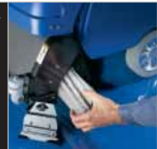
Eenvoudige en snelle lediging van de vuilwatertank in een afvoerput of gootsteen.