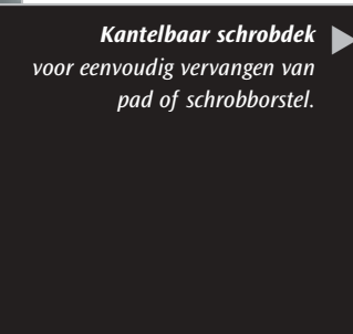
Kantelbaar schrobdek voor eenvoudig vervangen van pad of schrobborstel.