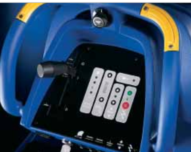
Ergonomisch gevormd bedieningspaneel, door o.a. gebruiksvriendelijk en overzichtelijk geplaatste rijbediening voor voorkomen en achteruitrijden om vermoeidheid van de gebruiker te voorkomen en een schoonwater indicatie.